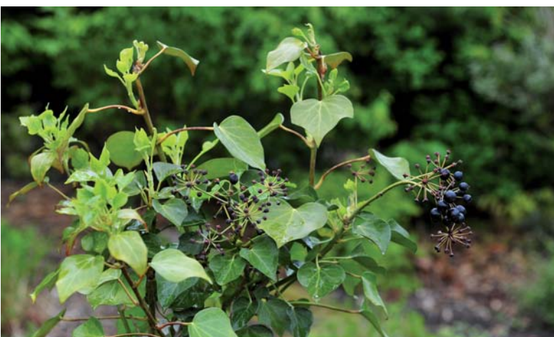
Hedera helix 'Norðic Great Choize' (buskvedbend). En buskformet voksenform af Hedera helix . Hurtigtvoksende og bliver op mod 50 cm høj og 1 meter bred og danner et effektivt bunddække. Sætter blomster, men får kun få frugter. Tåler stærk skygge og vind og svides ikke - eller kun yderst sjældent - af barfrost. Værdifuld fornyelse af stedsegrønne bladplanter. Sorten er udvalgt af A-Plant i et projekt udført i samarbejde med Statens Planteavlsforsøg. Produktionen sker på Nygaards Planteskole.

Midwest Groundcover hvorefter de valgte planter vil blive markedsført.